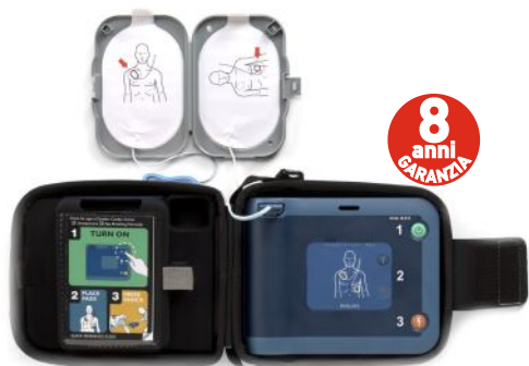
DEFIBRILLATORE PHILIPS HEARTSTART FRx CON BORSA, BATTERIA, ELETTRODI