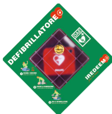
TECA MURALE PER DEFIBRILLATORE CON ALLARME ACUSTICO